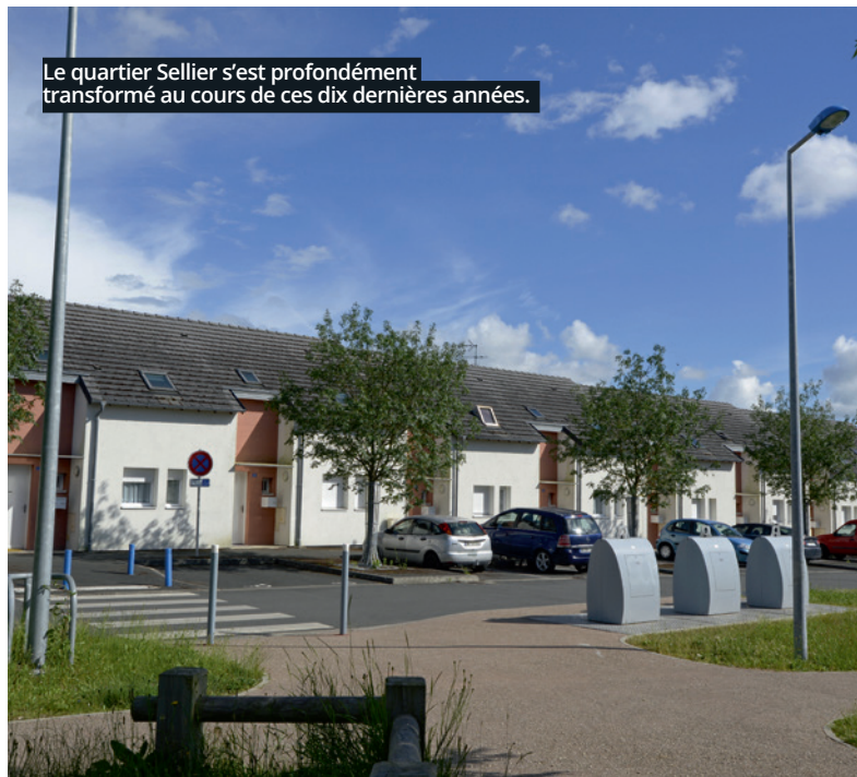
Le quartier Sellier s'est profondément transformé au cours de ces dix dernières années.

C'est une très bonne nouvelle car c'est une possibilité d'action pour la collectivité. Et ce d'autant plus que la Ville est largement aidée par de nombreux partenaires financiers avec le NPRU. L'intérêt est de pouvoir s'attaquer au centre-ville et au Clos-du-Roy. En plus du logement, la qualité des espaces publics va être traitée. C'est une façon forte pour nous d'intervenir à une époque où les centre-villes des villes moyennes sont mis à mal sur le plan du commerce, des services et des usages en général. Un plus pour tous les Vierzonnais car le centre-ville concerne tous les habitants.