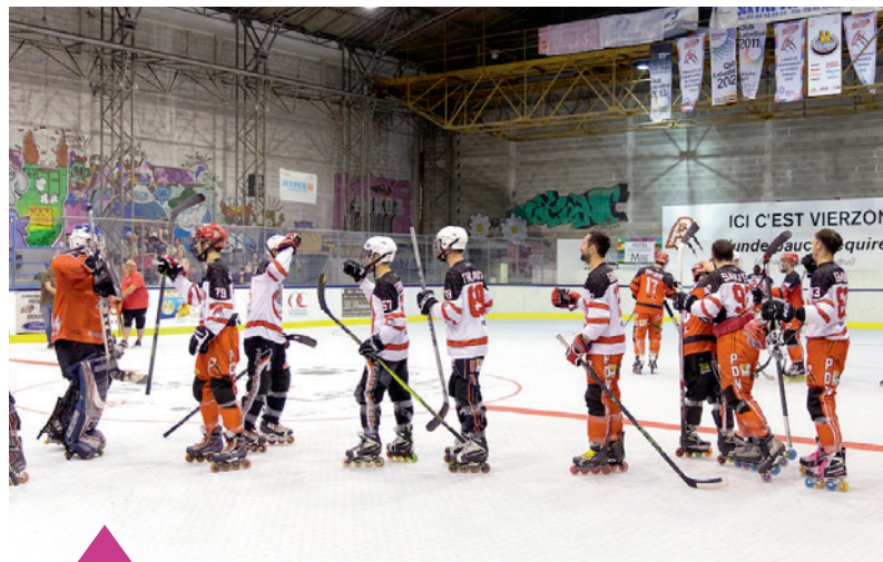
Amélie Canon - Droits réservés