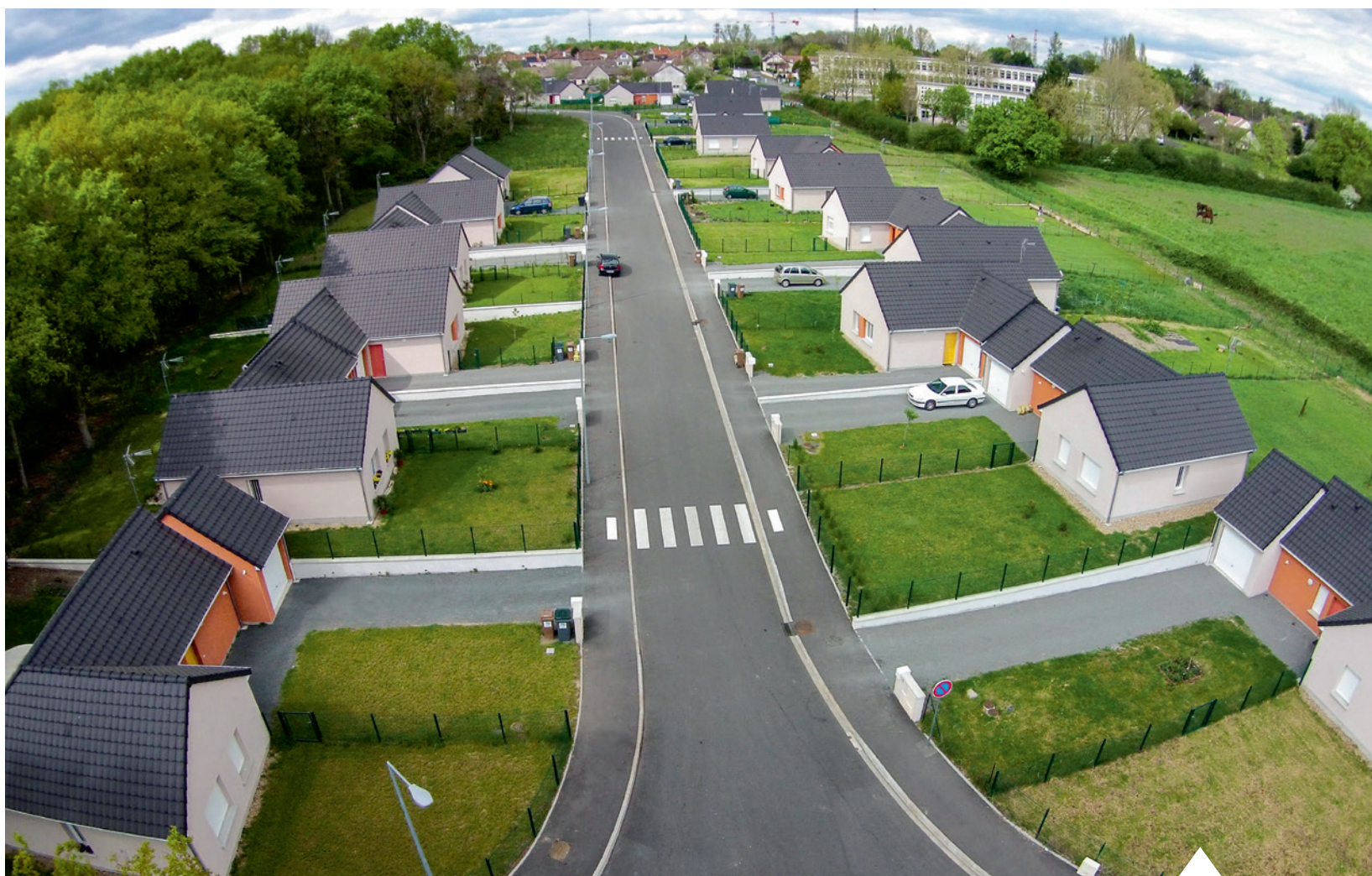
Le lotissement HLM du Champ des renards, rue Pierre Ferdonnet.