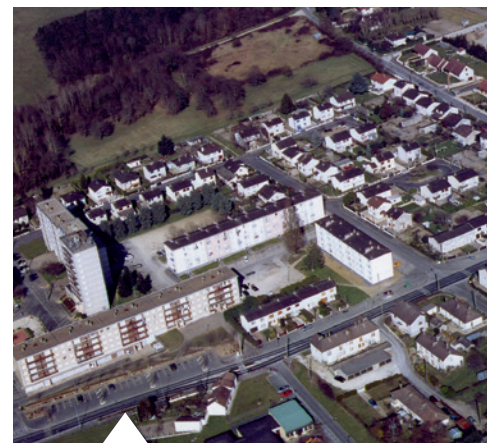
Le quartier du Colombier à sa construction.