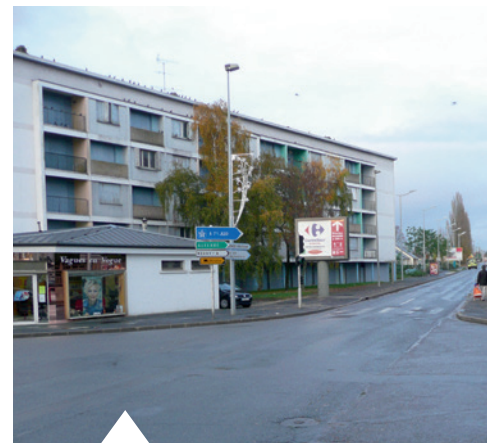
Entrée de Sellier avant la création du giratoire.