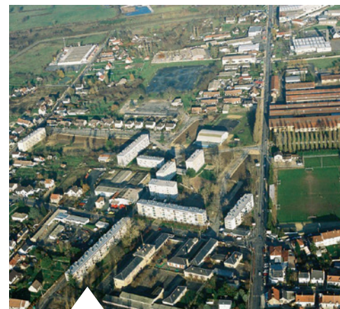
Le quartier Sellier tel qu'il était avant les travaux.