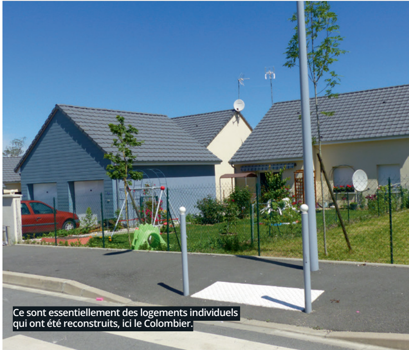
Ce sont essentiellement des logements individuels qui ont été reconstruits, ici le Colombier.

Colombier. « On était heureux d'avoir une maison avec un jardin même si au début on n'y mettait pas les pieds, on n'avait pas l'habitude ! »