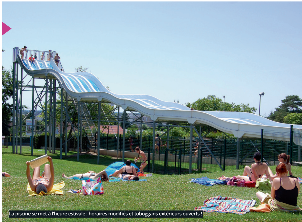
La piscine se met à l'heure estivale : horaires modifiés et toboggans extérieurs ouverts !