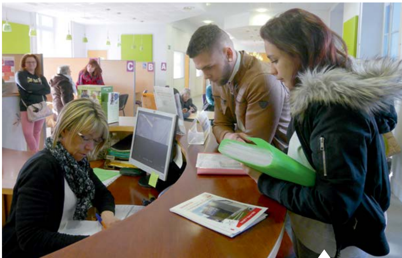
La mairie reçoit le public du lundi au vendredi pour de nombreuses demandes : guichet unique, état civil, renouvellement de cartes d'identité...