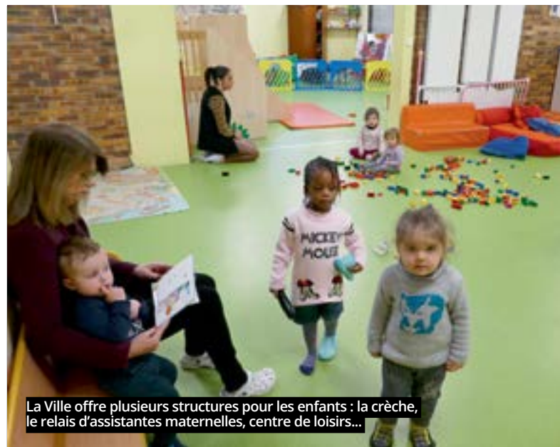
La Ville offre plusieurs structures pour les enfants : la crèche, le relais d'assistantes maternelles, centre de loisirs...