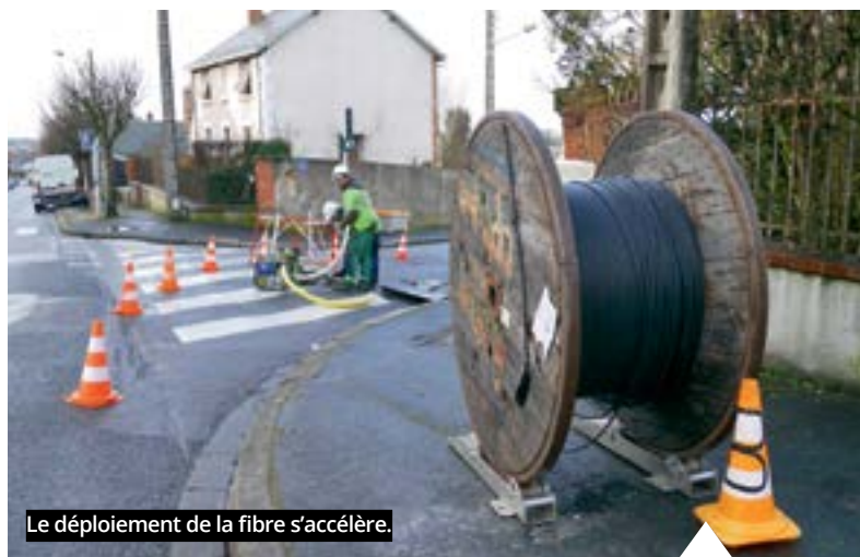
Le déploiement de la fibre s'accélère.

Contact : service élections au 02 48 52 65 06 ou serviceelections@ville-vierzon.fr