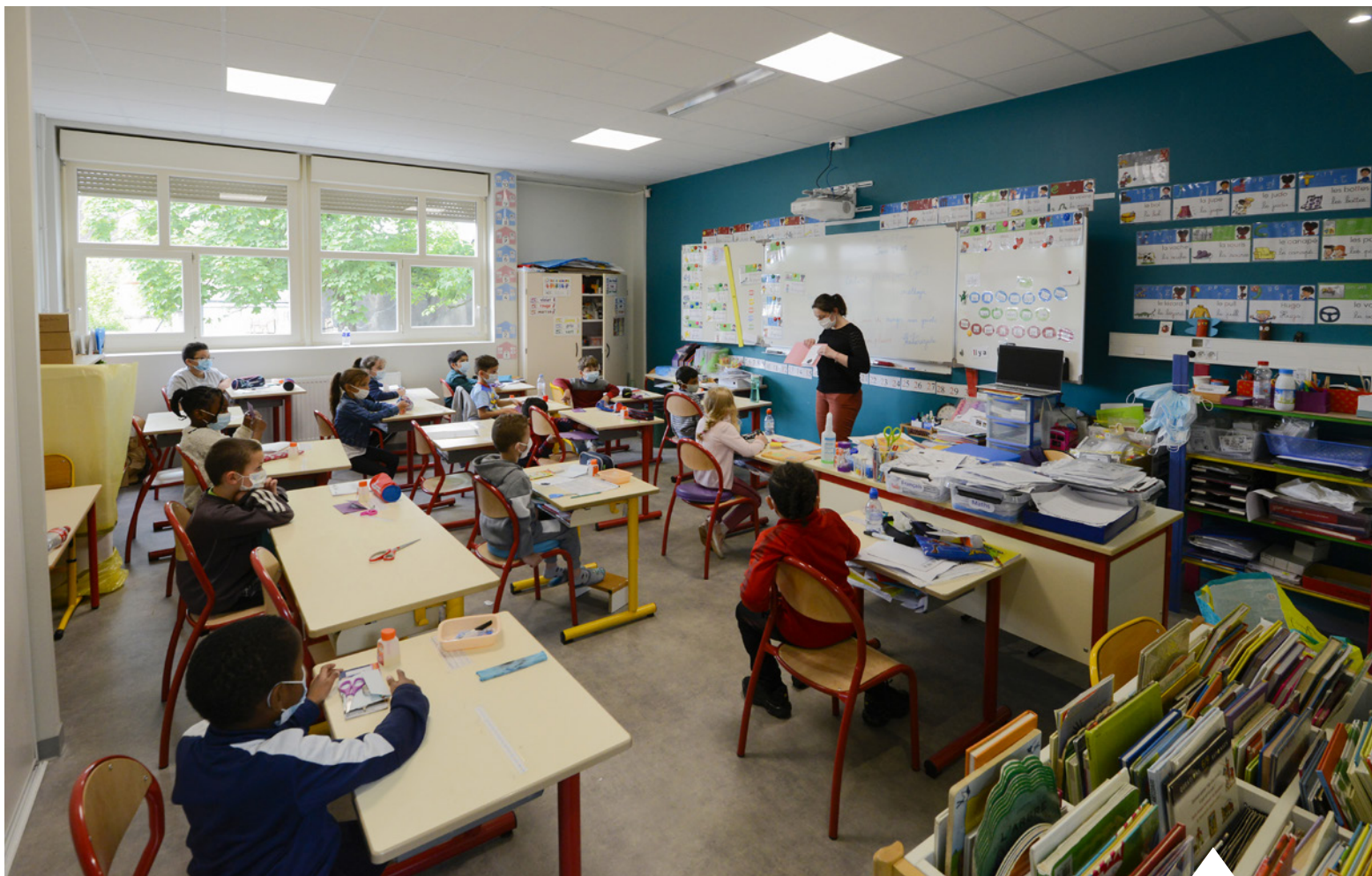
La municipalité a lancé depuis 2017 un large programme de rénovation des écoles.