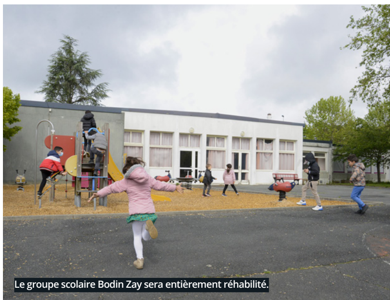
Le groupe scolaire Bodin Zay sera entièrement réhabilité.