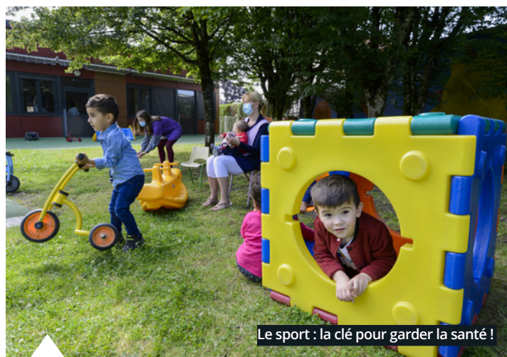
Le sport : la clé pour garder la santé !