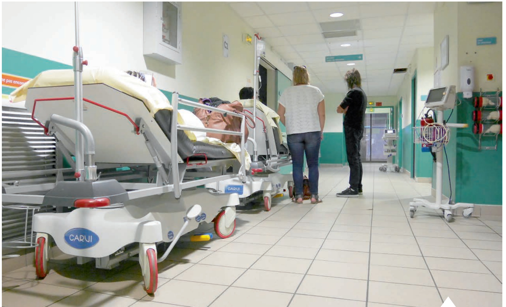
Les urgences de l'hôpital de Vierzon reçoivent chaque année plus de 22 000 personnes.