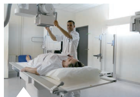
Une des salles de radiologie vient d'être rénovée.