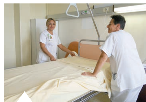
En 2017, l'hôpital a enregistré plus de 37 000 journées d'hospitalisation.