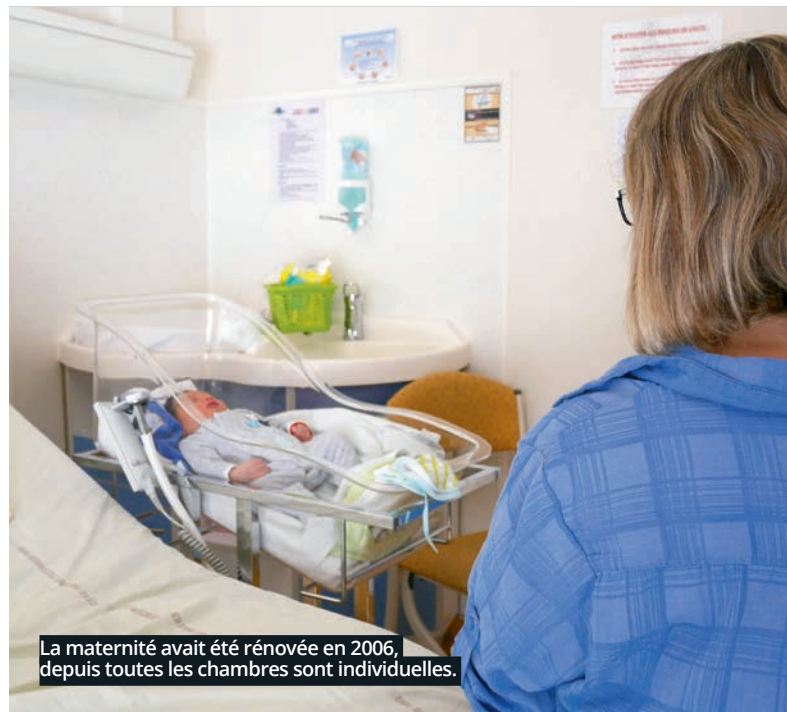
La maternité avait été rénovée en 2006, depuis toutes les chambres sont individuelles.

L'hôpital de Vierzon est le plus grand hôpital de proximité de la région Centre Val-de-Loire. L'an dernier, ce sont 26 726 patients qui sont venus consulter un spécialiste, près de 500 accouchements, 660 sorties du SMUR, 15 000 examens de radiologie... Le centre hospitalier est réparti sur deux sites. Le premier situé rue Léo Mérigot est le plus ancien. Il existe depuis 1870 et comprend aujourd'hui les services de médecine, de chirurgie, d'obstétrique et de pédiatrie. Le site de La Noue accueille les services de soin de suite, de rééducation, de gériatrie, de soin de longue durée ainsi qu'un Ehpad. L'hôpital compte aussi un laboratoire où chaque année près de 270 000 actes de biologie sont réalisés. Enfin, un Institut de formation aux soins infirmiers est rattaché au centre hospitalier.