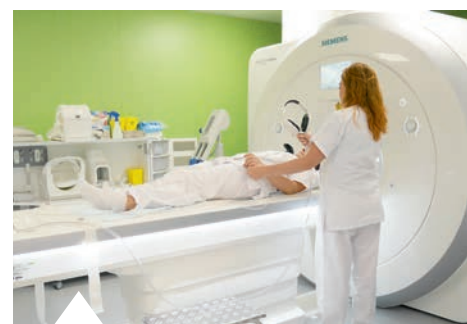
En 2016, un appareil IRM a été mis en service.

Le centre hospitalier est le pilier de l'offre de soins sur le territoire, il rend un grand service médical aux habitants. Parmi les patients, 56% viennent de Vierzon. Tous les autres sont originaires des alentours mais aussi de l'Indre, du Loir-et-Cher... De nombreux patients reçoivent leur traitement de chimiothérapie à Vierzon même s'ils sont suivis à Bourges ou Tours, cela leur évite des déplacements fatigants. « L'hôpital joue aussi un rôle important dans l'éducation thérapeutique des patients », soutient Nathalie