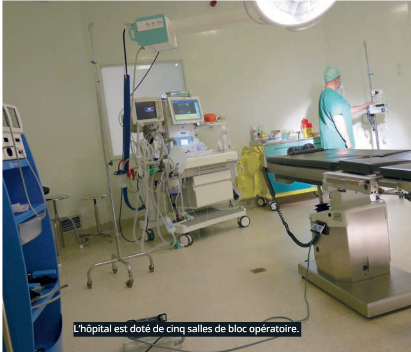
L'hôpital est doté de cinq salles de bloc opératoire.