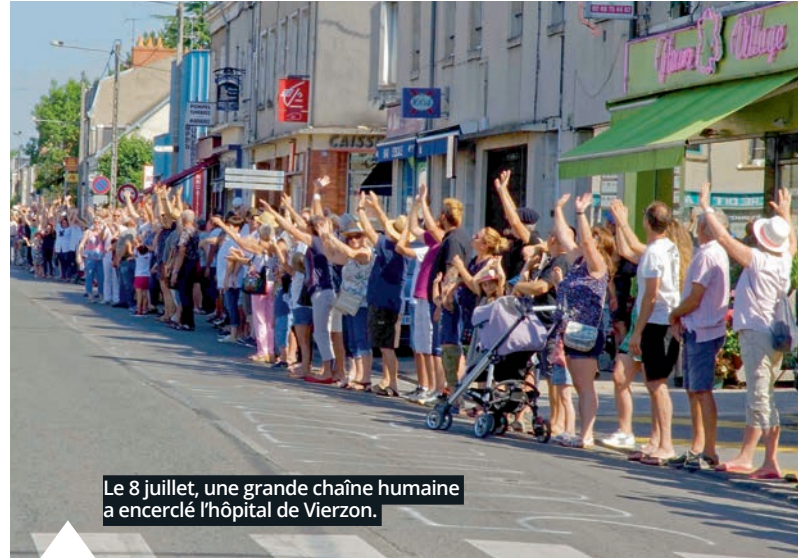
Le 8 juillet, une grande chaîne humaine a encerclé l'hôpital de Vierzon.