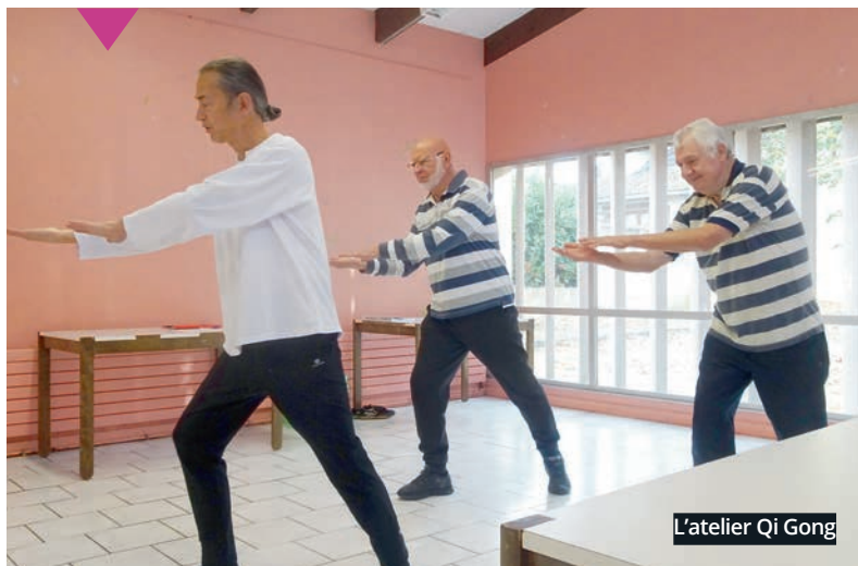
L'atelier Qi Gong

Le CCAS adapte continuellement l'offre d'activités en direction des personnes âgées pour mieux répondre à leurs besoins et leurs envies. Trois nouveaux ateliers ont ainsi vu le jour cet automne :