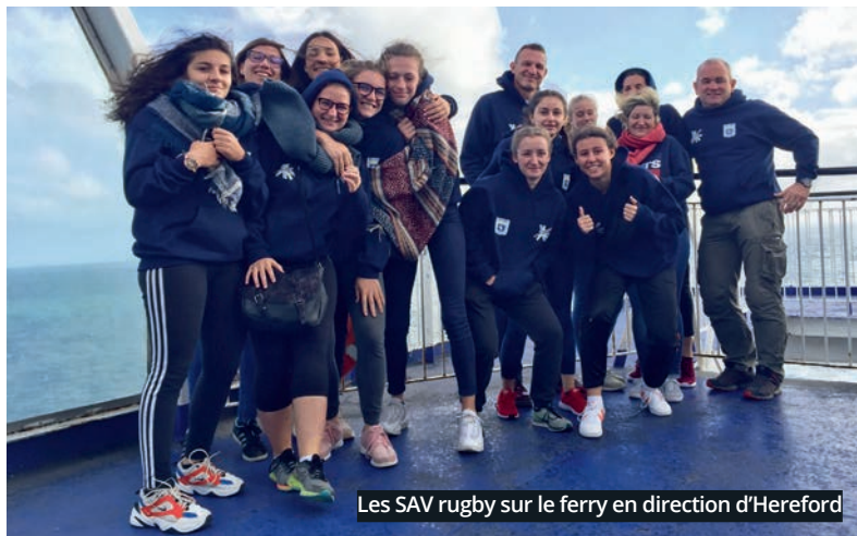
Les SAV rugby sur le ferry en direction d'Hereford

Vendredi 9 novembre : 14-18 en chansons par Marie-Hélène Fery à 20h30 à La Décalle. Samedi 10 novembre : conférence « Vierzon pendant la Guerre » à 15h à la médiathèque. Dimanche 11 novembre : commémoration officielle à partir de 10h15 et cérémonie pacifiste à 15h. Samedi 24 novembre : lecture théâtralisée à la médiathèque sur le rôle des femmes dans la Grande Guerre par la Compagnie Prométhéâtre.