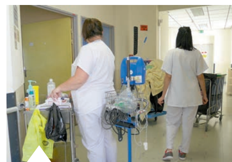
L'hôpital compte plus de 800 emplois (en équivalent temps plein).