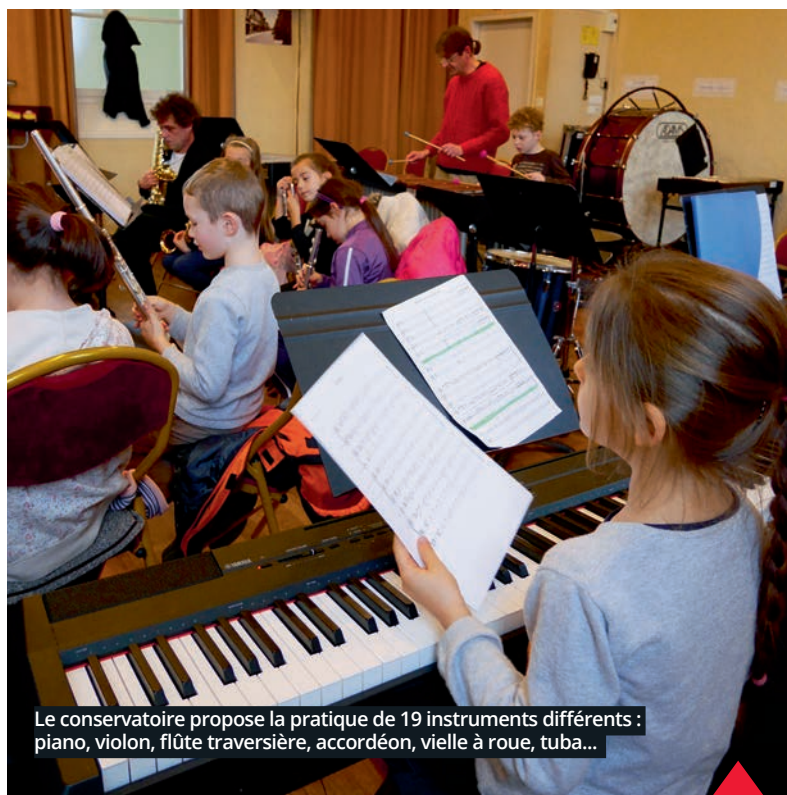
Le conservatoire propose la pratique de 19 instruments différents : piano, violon, flûte traversière, accordéon, vielle à roue, tuba...