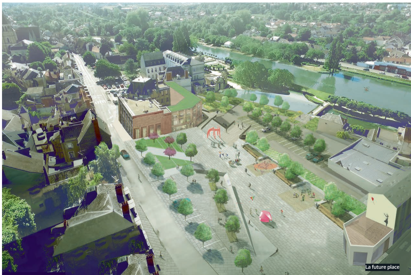
La future place