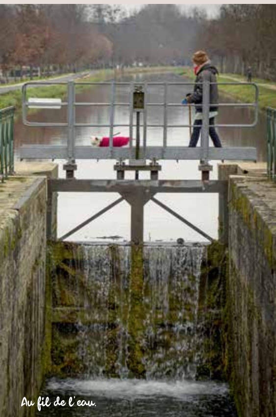
Au fil de l'eau.