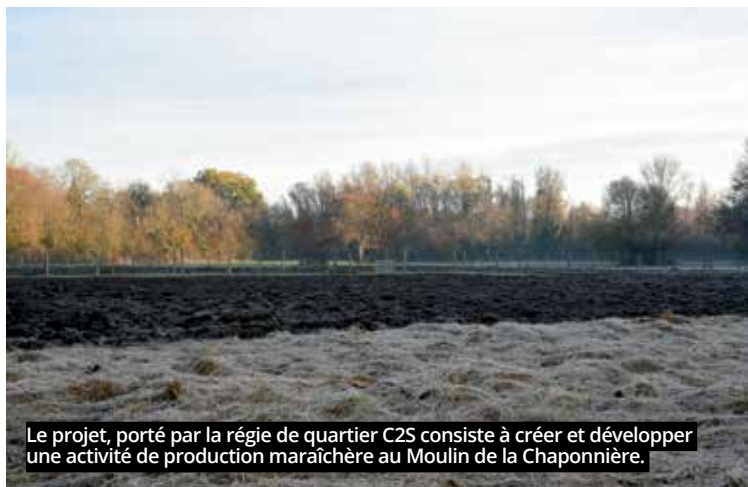
Le projet, porté par la régie de quartier C2S consiste à créer et développer une activité de production maraîchère au Moulin de la Chaponnière.

Au Nord de Vierzon, au carrefour de Puits Berteau, se développe désormais un véritable pôle santé : le laboratoire d'analyses et le Centre de santé installés depuis plusieurs années seront bientôt voisins du nouveau centre médico-psychologique qui se construit actuellement. Ce centre médico-psychologique déménagera donc à terme pour prendre place dans ses nouveaux locaux. Le centre de santé est pour sa part, à la veille de son 3 e anniversaire en pleine croissance. L'arrivée de trois nouveaux médecins généralistes offre la possibilité à près de 1 000 patients supplémentaires d'accéder à un médecin traitant. Les locaux devraient voir bientôt une extension agrandir cet équipement aujourd'hui solidement ancré dans le paysage médical vierzonnais.