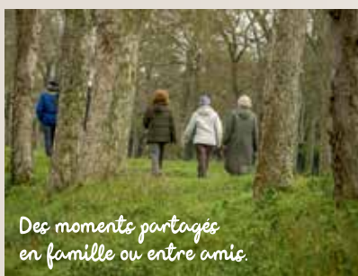
Des moments partagés en famille ou entre amis.

Sur le parcours, vous découvrirez au moins deux écluses. Le canal en compte 97 sur l'ensemble de son tracé. De tailles modestes, les écluses mesurent entre 2,70 mètres de largeur et 27,75 mètres de longueur. À la grande époque, vers 1900, mille péniches par an - les berrichonnes - empruntaient ces ouvrages d'art. Parfois, de petites maisons accolées étaient le lieu de résidence des éclusiers qui avaient aussi la charge de l'entretien du canal.