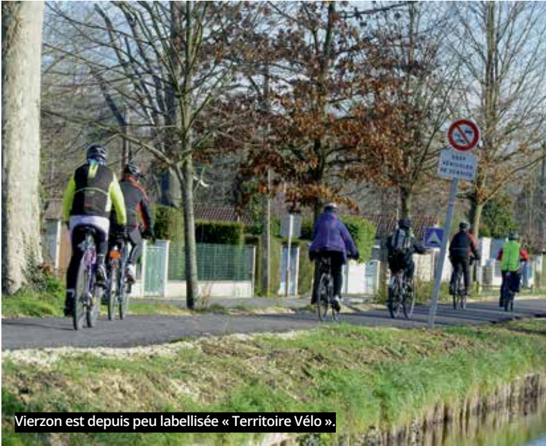
Vierzon est depuis peu labellisée « Territoire Vélo ».

cyclables. Si la ville compte aujourd'hui 7 km de liaisons cyclables, de nouveaux aménagements de voirie sont à créer pour relier « l'arête dorsale » que constitue le Canal à vélo au centre ville et tracer des ramifications vers les différents quartiers et principaux sites municipaux (établissements scolaires, administrations, hôpital...). Cela suppose de composer avec la configuration de la voirie, souvent étroite, et avec les contraintes financières, ces aménagements étant très coûteux.