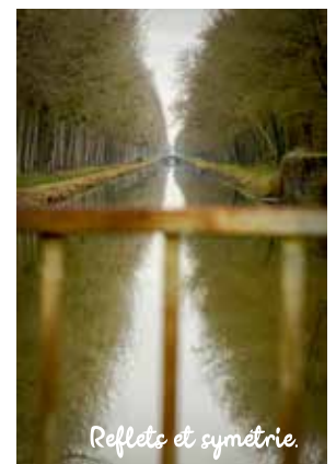
Reflets et symétrie.