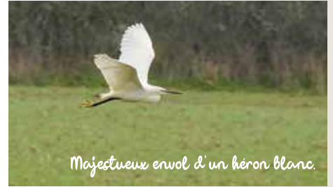
Majestueux envol d'un héron blanc.