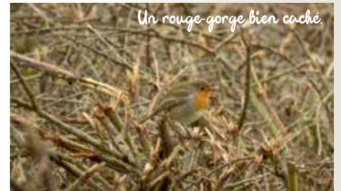
Un rouge-gorge bien caché.