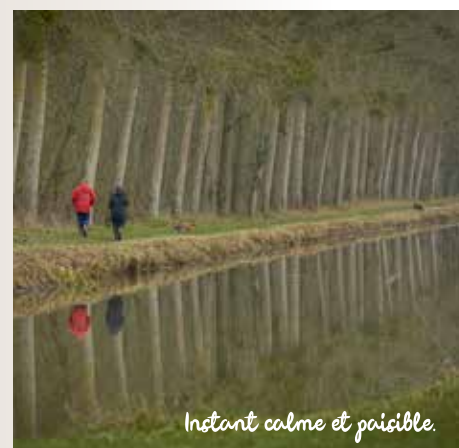
Instant calme et paisible.