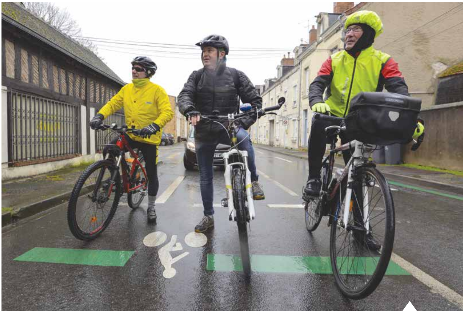
Des aménagements cyclables ont été réalisés récemment, ici rue Miranda De Ebro.