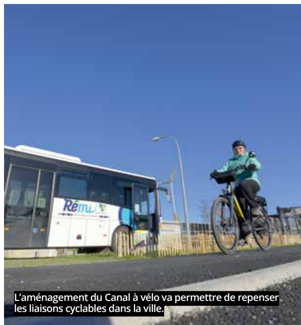
L'aménagement du Canal à vélo va permettre de repenser les liaisons cyclables dans la ville.