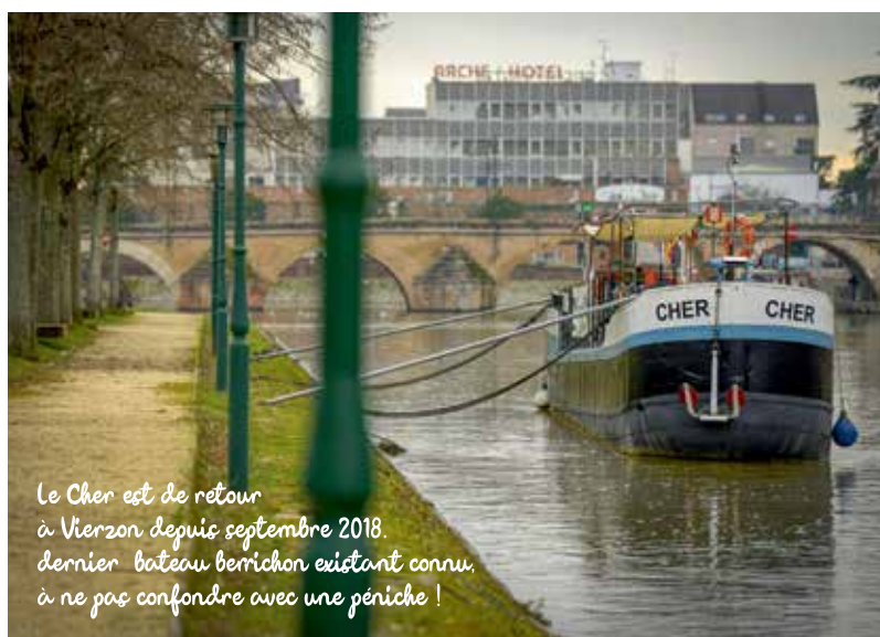
Le Cher est de retour à Vierzon depuis septembre 2018. dernier bateau berrichon existant connu, à ne pas confondre avec une péniche !

La traversée de la ville est balisée et déjà quasiment aménagée. Une piste cyclable guide le touriste après une portion du canal qui fut comblée dans les années 60. Ainsi, ce dessine Vierzon autrement. Des bancs jalonnent le parcours maintenant goudronné. Un arrêt minute sur l'un d'entre eux permet de prendre le temps d'écouter les passereaux chanter à tue-tête, à peine gênés par le grincement des engins du port sec. Le coup de pédale facile conduit rapidement sous le pont de la voie ferrée. Ici, le canal s'élargit. Quelques friches industrielles rappellent le passé manufacturier de Vierzon. Les murs tagués, les briques rouges, les éclats de feu qui jaillissent par la fenêtre brisée d'une fonderie créent un univers de poésie au labeur brut des hommes de l'art. Ici, s'arrête notre périple à la gare de Vierzon-Forges. Une percée bien-être qui dévoile nature, culture et histoire.