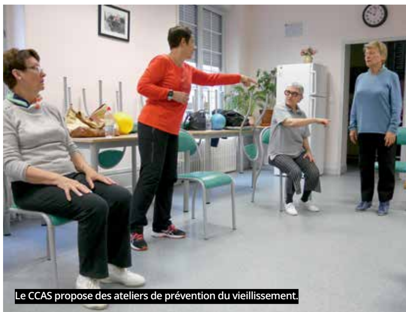
Le CCAS propose des ateliers de prévention du vieillissement.

comme la maternité avaient été menacés en 2018. Après une lutte acharnée des personnels soutenus par la municipalité et les habitants, l'ensemble des services a été maintenu mais la vigilance reste de mise. Au-delà de l'hôpital, les départs à la retraite de plusieurs généralistes en ville posent aussi la question de la continuité du suivi médical de la population ; et par conséquent de la qualité de ce suivi. Face aux menaces liées à la désertification médicale, la Mairie a été à l'origine de la création, en 2018, du Centre de santé, prévu par le contrat local de santé 2016-2019. Trois ans après son ouverture, au cœur du quartier Henri Sellier, il enregistre 30 000 actes par an et 5 000 Vierzonnais y ont leur médecin traitant !