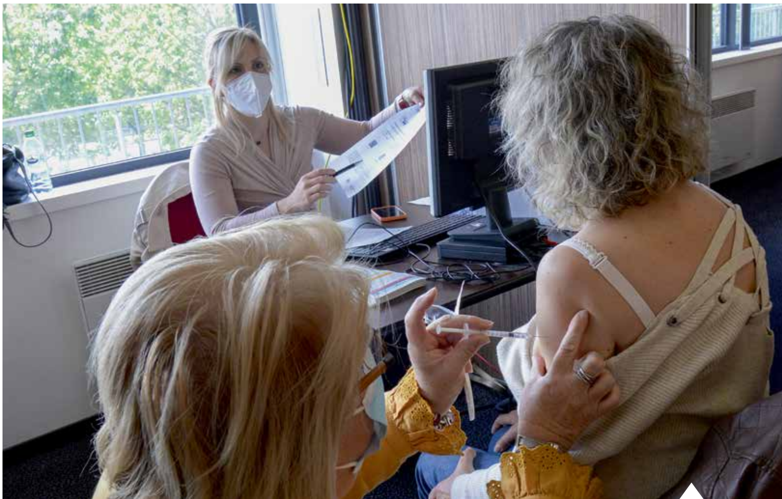
La vaccination à Vierzon se déroule au Centre de congrès.