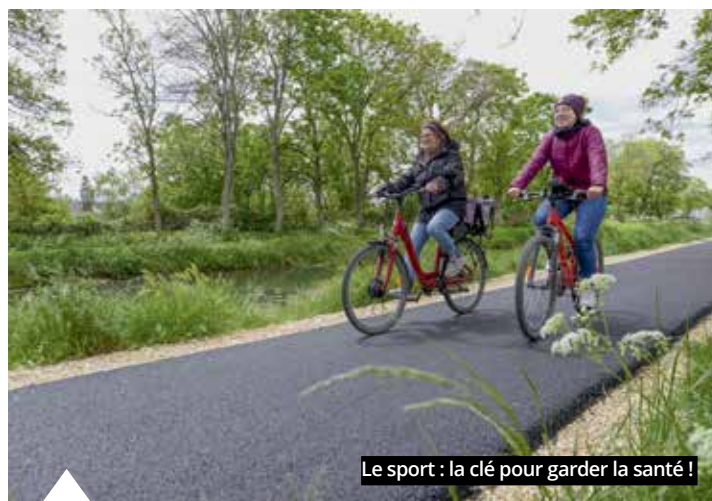
Le sport : la clé pour garder la santé !