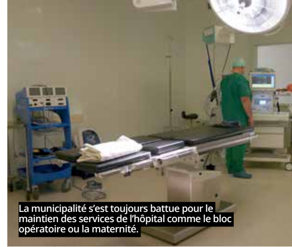
La municipalité s'est toujours battue pour le maintien des services de l'hôpital comme le bloc opératoire ou la maternité.

S'il y a pu y avoir la queue dehors, par moment, c'est surtout parce que les patients arrivent en avance ; mais quand tout le monde est précisément à l'heure, la partition est réglée comme du papier à musique : « Le Centre des congrès est assez grand pour qu'une cinquantaine de personnes patientent à l'intérieur dans le respect des distances, précise Alyson. Puis elles sont reçues par un infirmier ou un médecin, dans l'un des huit box dressés pour l'occasion. » Quand les doses - essentiellement du Pfizer - viennent à manquer, l'équipe médicale puise dans les frigos, installés au fond de la salle et régulièrement renfloués grâce à une coordination très efficace. « Deux fois par semaine, nous sommes livrés d'une quantité de doses fixée, décrypte Xavier Pascal, le coordinateur de la CPTS. Nous gérons au plus juste les stocks. S'il reste des doses à la fin de la journée, on peut prendre quelques patients qui n'étaient pas inscrits. Depuis le début, aucune dose n'a été jetée. »